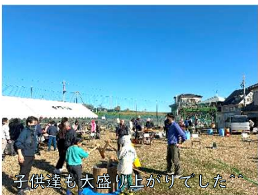
子供達も大盛り上がりでした^^