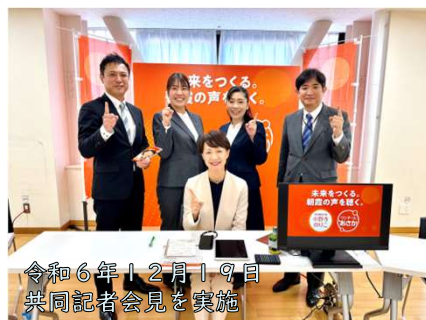
令和6年12月19日 共同記者会見を実施