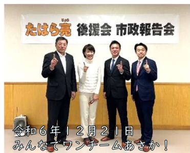
令和6年12月21日 みんなてワンチームあさか！