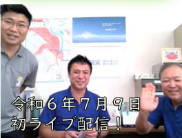
令和6年7月9日 初ライブ配信！