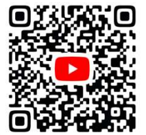
たはら亮ちゃんねる