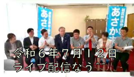
令和6年7月12日 ライブ配信なう^^