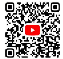
たはら亮ちゃんねる