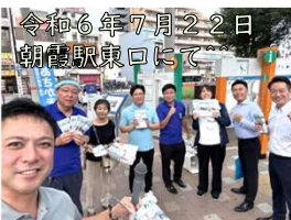
令和6年7月22日 朝霞駅東口にて