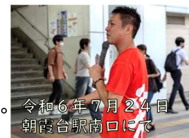
令和6年7月24日 朝霞台駅南口にて

あさか未来の新しい会派報が完成しまして、折込はもちろん恒例の駅頭PR活動を有志で実施しました。初日は何と全員集合！でもこの暑さですから、絶対に無理せず積極的な途中離脱を推奨しての実施です。沢山の方々に会派報を受け取っていただき、感謝を申し上げます！