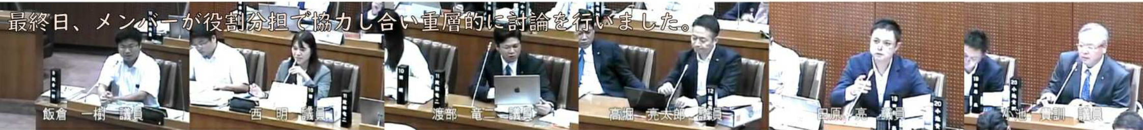
最終日、メンバーが役割分担で協力し合い重層的に議論を行いました。

その結論として、我々あさか未来は前年度決算議案については認定とする一方で、認定された原案に対し未来志向でより良いものにして欲しいという 思いと願い を込めて、附帯決議を提出することを決めました。附帯決議とは、その対象となる事件（今回は一般会計歳入歳出決算認定）が可決された後に、その原案に対して議会が意見や要望を付するものであり、決算認定議案に対し附帯決議が提出されるのは 恐らく初めての ことです。