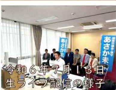
令和6年7月13日 生ライブ配信の様子