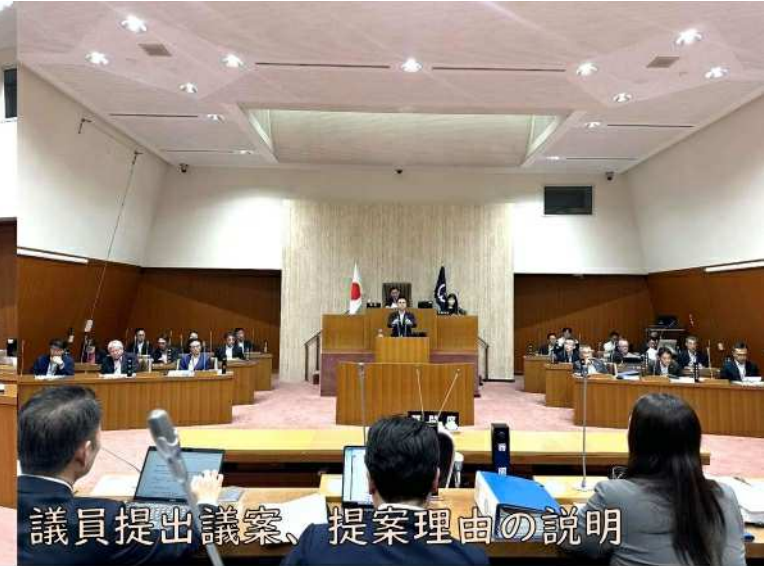
最終日に議員提出議案を2本提出