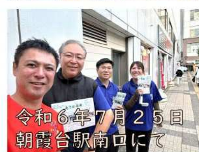
令和6年7月25日 朝霞台駅南口にて

また、朝霞市議会では(今のところ?)唯一となる会派の公式YouTubeチャンネル「あさか未来ちゃんねる」を開設!コンテンツの充実にも取り組んでいます。これまで発信した生ライブ配信も、アーカイブ動画として残っておりますので、これを機会にぜひ!YouTubeを視聴されている皆様は、チャンネル登録を宜しくお願い申し上げます👍