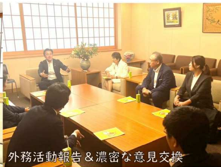
会派全員で外務省を表敬訪問