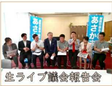
生ライブ議会報告会

朝霞市議会の最大会派あさか未来では、市政を身近に感じていただけるよう、市政PR活動に力を入れています。年4回の議会が閉会したら必ず作成しているこの会派報「あさか未来」の発行、印刷が終わったら会派メンバー全員参加で行っている駅頭PR活動は、今ではあさか未来の名物行事となりました。そして議会や視察報告会にも注力しています。