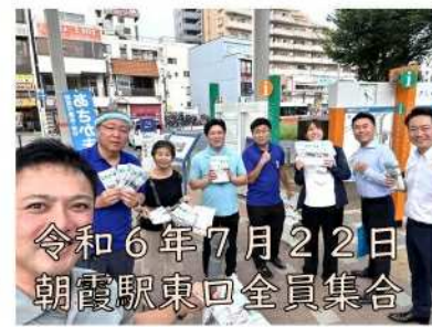
令和6年7月22日 朝霞駅東口全員集合

朝霞市議会の最大会派あさか未来では、市政を身近に感じていただけるよう、市政PR活動に力を入れています。年4回の議会が閉会したら必ず作成しているこの会派報「あさか未来」の発行、印刷が終わったら会派メンバー全員参加で行っている駅頭PR活動は、今ではあさか未来の名物行事となりました。そして議会や視察報告会にも注力しています。