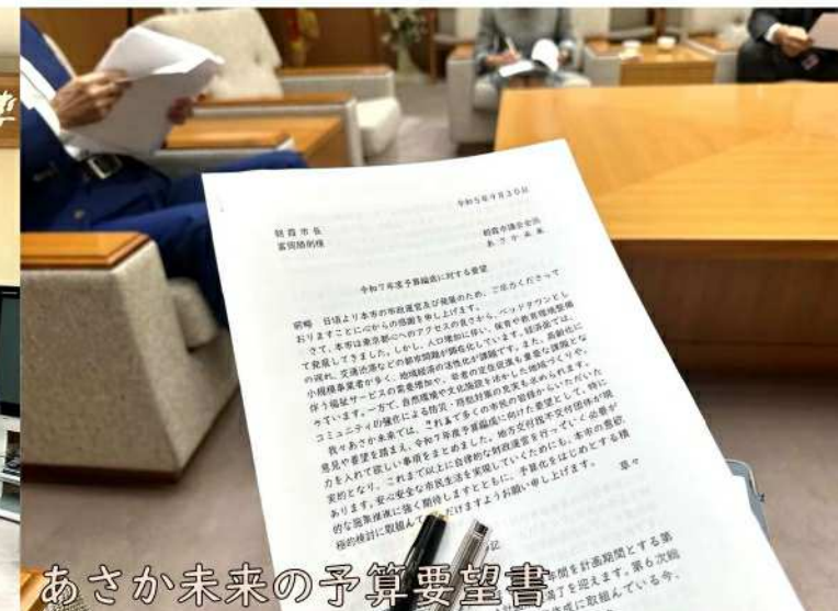
全員が自分の言葉で要望^^